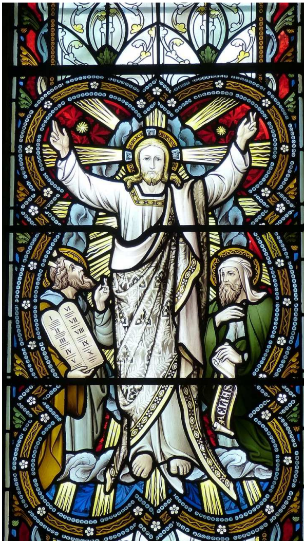
Verklärung Jesu, 2. Fastensonntag